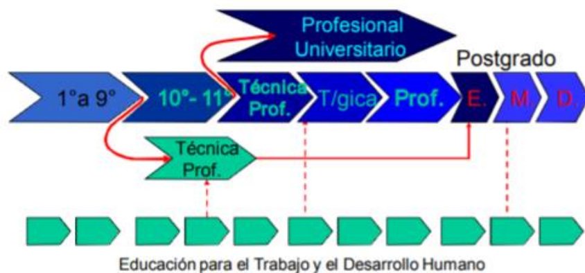
Fig.11 Articulación de la Educación Media Técnica y La Educación Superior

La formación técnica laboral se imparte de manera conjunta y articulada entre el Colegio y la Corporación, de tal manera que el proceso de formación sea complementario; aprovechando de la mejor manera los recursos de ambas instituciones. La formación práctica especializada se lleva a cabo en las instalaciones de la Corporación ISES con Docentes de los programas Técnicos; fomentando la interacción con los estudiantes Técnico Profesionales y el ambiente universitario. Algunos colegios con los que se ha desarrollado el proceso son el Colegio Unidad Educativa el Futuro del Mañana (UEFM) y el Colegio por Ciclos Emmanuel Rubiano.